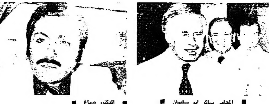
الحل السياسي يجب ان يسبق الحل الأمني، وهذا هو الموقف الذي اتفقوا عليه المشاركون في اللجنة الرباعية.

انطباعات غير متفائلة بالنسبة لاجتماع اللجنة العربية الرباعية، وبنسبة لاجتماع القاهرة، عاد بها بعض زوار القصر المصري أمس، وواضح كلام الزوار بان عقدة اتفاقية القاهرة لا حل لها في الوقت الحاضر، وان عدم حلها لا ينعكس بالاطمئنان اللبناني.